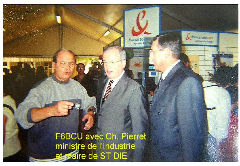
F6BCU avec Ch. Pierret ministre de l'Industrie et maire de ST DIE

F6BCU avec Ch. PIERRET Ministre de l'industrie et Maire de ST DIE